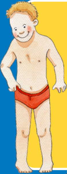
VUJADAN- BIVTTAS- NJUOLGGADUS

Lea buorre, ahte leat mánggalágan gorudat.