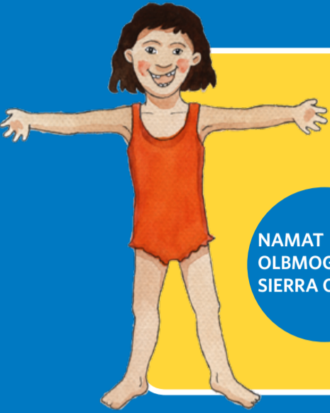
NAMAT OLBMGORUDA SIERRA OSIIDE