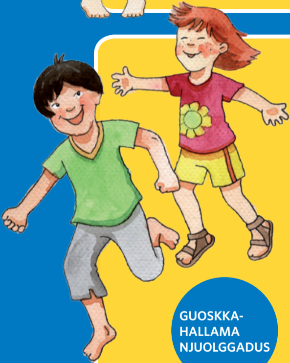
GUOSKKA- HALLAMA NJUOLGGADUS

Daid eai láve čájáhallat buohkaide, vaikko dat leatge buorit ja divrasat.