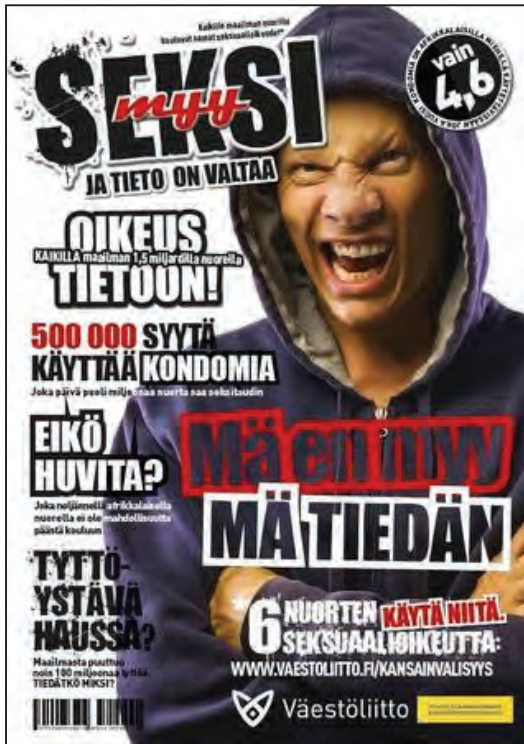
Kuva 2. Yksi seksuaalioikeusjulistesarjan kuvista. Väestöliitto, 2011

Opetettavat asiat tulisi esittää pojille koulussa sellaisella tavalla, joka on mahdollisimman realistinen ja aito, ja joka voi tapahtua poikien elämässä oikeasti tässä ja nyt. Tunneilla käsiteltävä seksuaalitieto tulisi liittää niihin nuoria koskeviin paikkoihin ja elämäntilanteisiin, joissa heidän seksuaalisuutta koskeva tiedonmuodostuksensa ja kokemuksensa varsinaisesti tapahtuvat. Poikien olisi hyvä kokea, että koulussa käsitelty asia voisi oikeasti tapahtua heidän omassa elämässään.