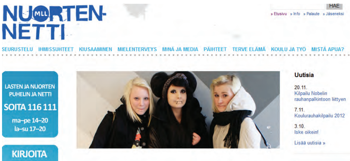
Kuva 3. www.mll.fi/nuortennetti

Yksikään seksuaalikasvatukseen pyrkivä sivusto ei tunnustaudu ajavan jommankumman sukupuolen asiaa. Silti ulkoasulla, värivalinnoilla ja kuvituksella luodaan osassa sivustoja vaikutelma, että tytöt ovat kuitenkin se varsinaisesti haettu käyttäjäryhmä (kuva 3). Rajaus saattaa olla täysin tiedostamatonta. Ulkoasulla on merkitystä, mutta aivan eritoten niin on sivun toimivuudella. Tiedon pitäisi olla nopeasti löydettävissä, esimerkiksi etsi-toiminnon tulee tehdä tehtävänsä. Tieto ei myöskään saisi olla hukutettuna pitkiin kappaleisiin vaan sen tulisi olla löydettävissä vaivatta nopeasti silmäillen.