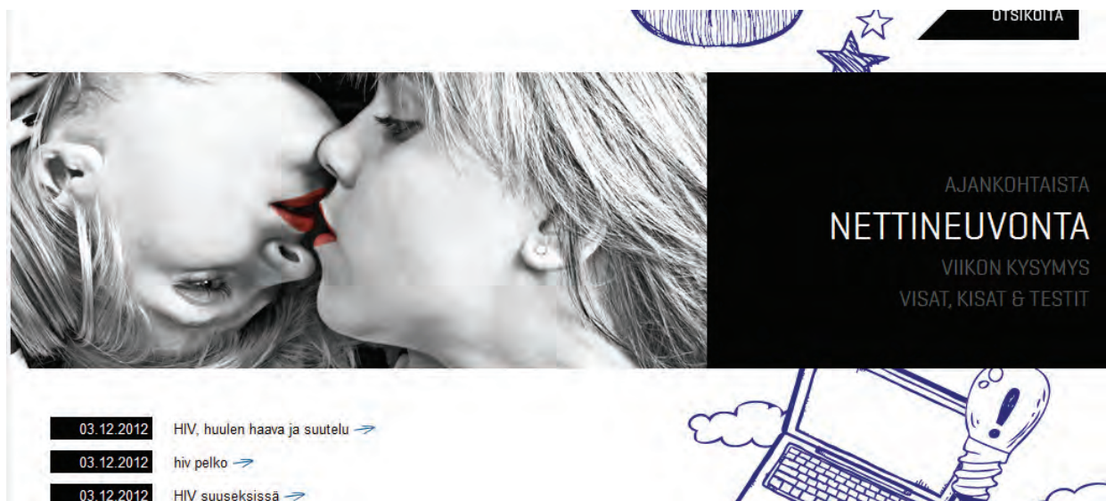
Kuva 5. www.justwearit.fi

Käyttämällä termejä kumppani, rakas, kulta jne. neutralisoidaan sisältö kaikille sopivaksi. JustWearIt on myös esimerkki sivustosta, jossa kuvituksella ja sanavalinnoilla luodaan kaikki huomioiva ja hyväksyvä ilmapiiri (kuva 5.)