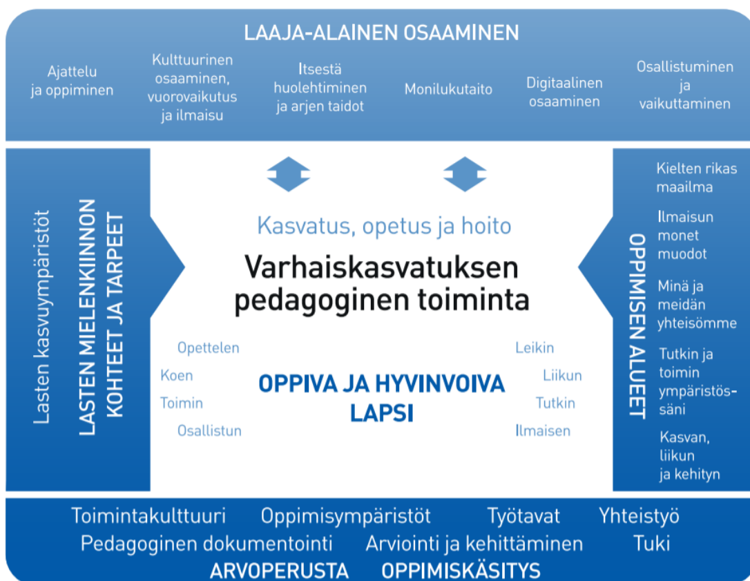
Kuvio 1. Varhaiskasvatuksen pedagogisen toiminnan viitekehys

Varhaiskasvatuksen pedagogista toimintaa ja sen toteuttamista kuvaa kokonaisvaltaisuus. Tavoitteena on edistää lasten oppimista ja hyvinvointia sekä laaja-alaista osaamista (kuvio 1). Pedagoginen toiminta toteutuu lasten ja henkilöstön välisessä vuorovaikutuksessa ja yhteisessä toiminnassa. Lasten omaehtoinen, henkilöstön ja lasten yhdessä ideoima sekä henkilöstön suunnittelema toiminta täydentävät toisiaan. Varhaiskasvatuksen pedagoginen toiminta läpäisee kasvatuksen, opetuksen ja hoidon kokonaisuuden.